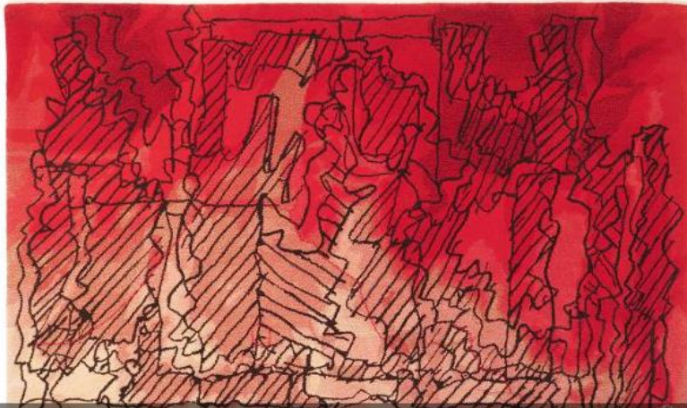
Coleção de Tapeçaria assinada por Frank Gehry em exposição em Lisboa

O Radio Palace, um palácio secular que já foi Museu da Rádio da Emissora Nacional, recebe, pela primeira vez em Lisboa, a coleção de tapetes assinada pelo arquiteto Frank Gehry.