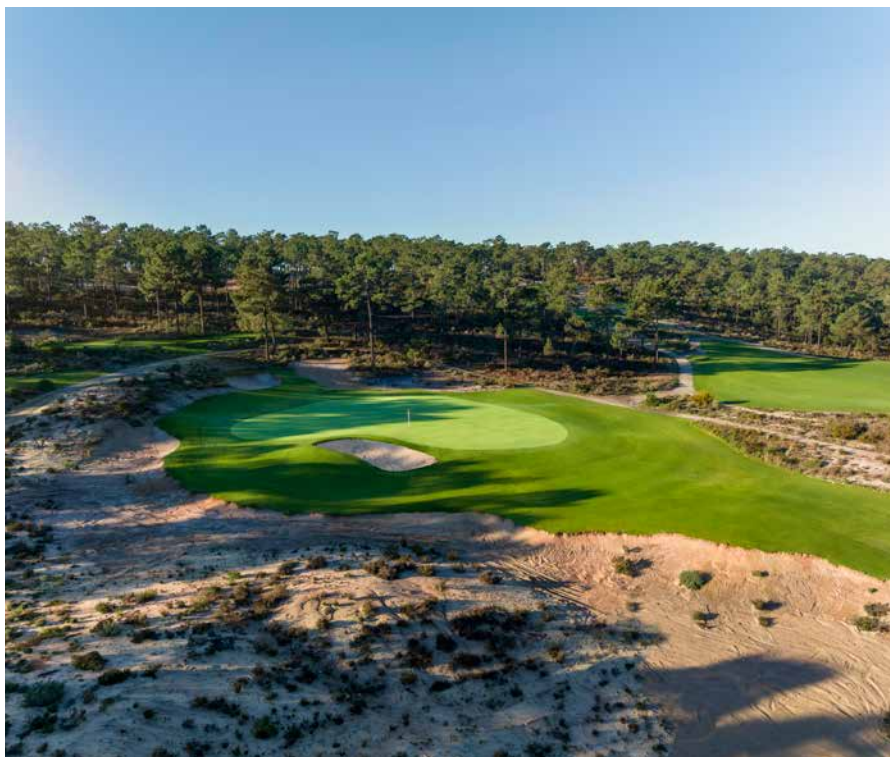
› De bunker naast de green van de par-3 veertiende doet bijna aandoenlijk aan, gelet op de enorme waste-area die er pal naast ligt.