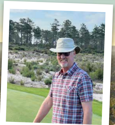
› Terras da Comporta is de eerste baan van David McLay-Kidd op het vasteland van Europa.

'Vaak hoor ik mensen klagen dat ze zo moeilijk uit een bunker kunnen komen en dat ze niet richting de green kunnen spelen. Natuurlijk niet! Daarom is het ook een hindernis'